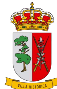
M.I. Ayuntamiento de la Villa de LA VICTORIA DE ACENTEJO